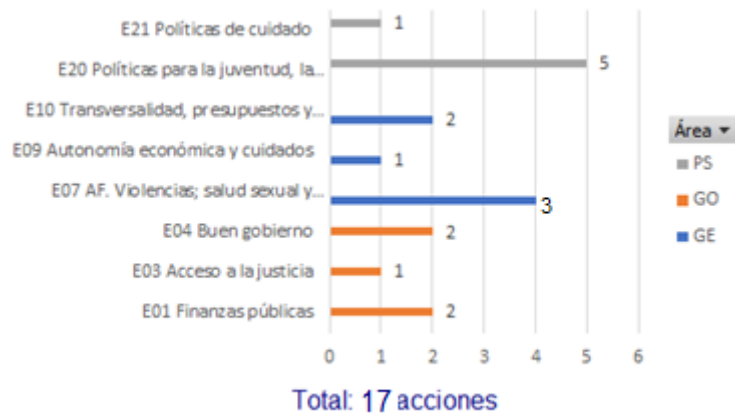
Procesos acompañados por EUROsociAL+

La infografía mostrada indica que, para el país, las acciones en curso se concentran en 8 líneas temáticas de las tres áreas de política pública del Programa: Género; Gobernanza y Políticas Sociales.